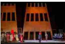
Visto da Lukas Franceschini

Scritto da Lukas Franceschini | STAMPA | EMAIL | Visite: 6