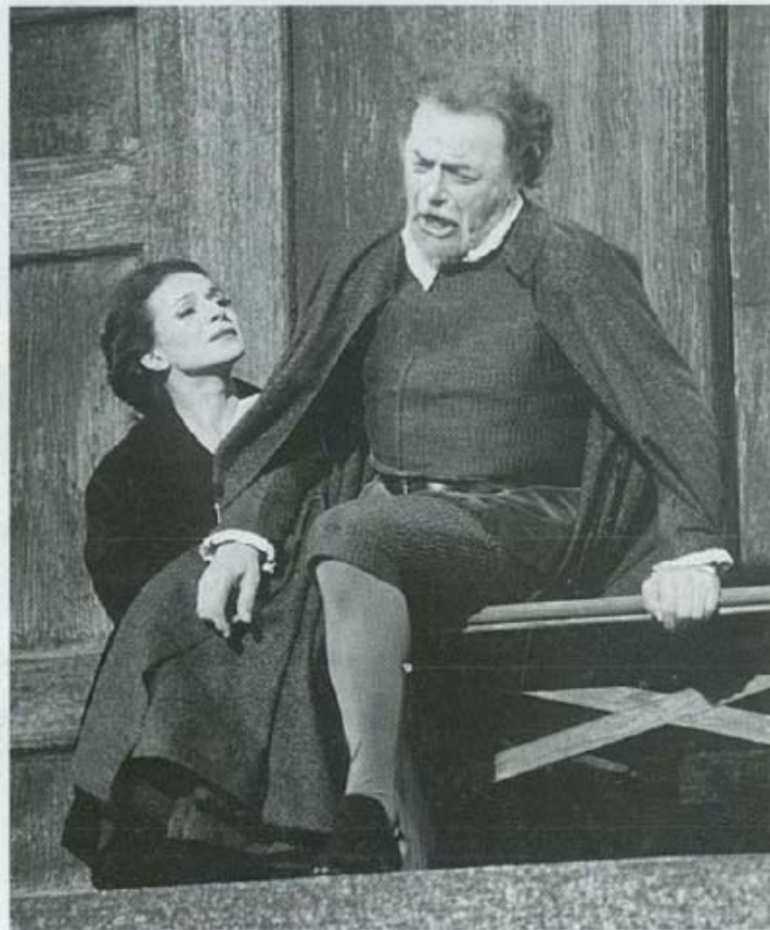
La cantante sarda interpreta il ruolo di Gilda nel "Rigoletto" di Giuseppe Verdi. Macerata, Arena Sferisterio, 1993