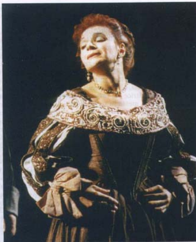
Giusy Devinu impersona Lucia nella "Lucia di Lammermoor" di Gaetano Donizetti. Milano, Teatro alla Scala, 1997

panico. Gli artisti più bravi sono quelli che si emozionano moltissimo e riescono a tenere i nervi saldi».