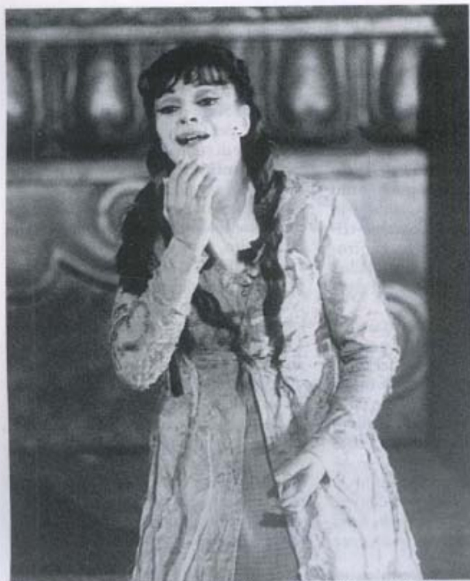
La Devinu veste i panni di Liù nella pucciniana "Turandot". Roma, Teatro dell'Opera, 1997